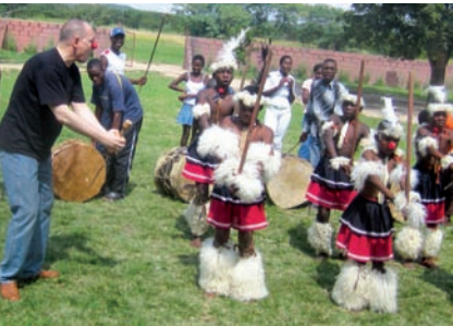
Afrikanischer Tanz trifft Clownspiel