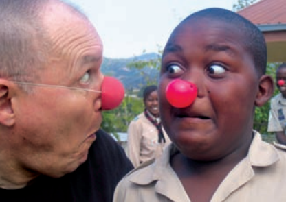
Clowns werden Freunde