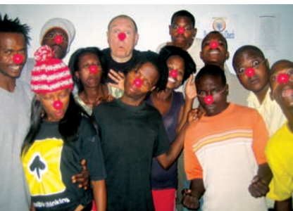
Workshop in der Clownschole